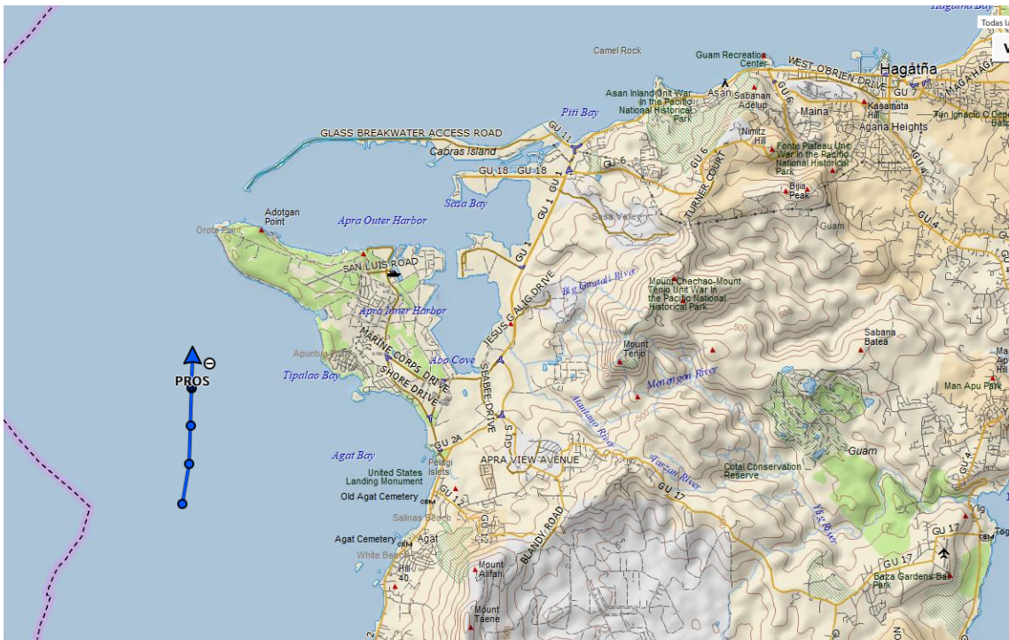
El Velero Pros arriba a Apra Harbor en la isla de Guam el 30 de abril de 2023