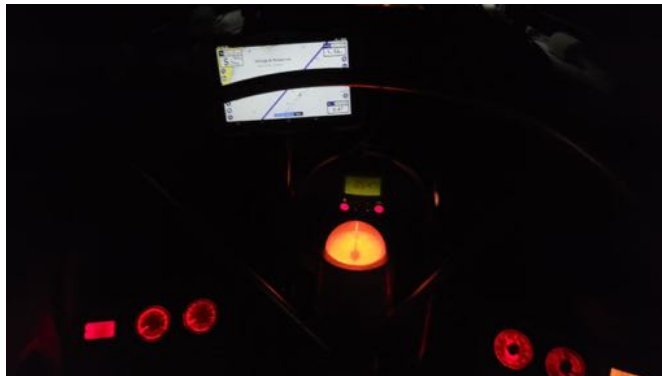
Puesto de mando del Mandragora.