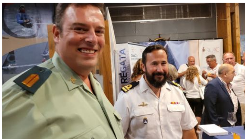
Representantes del Servicio Marítimo de la Guardia Civil y de la Armada.