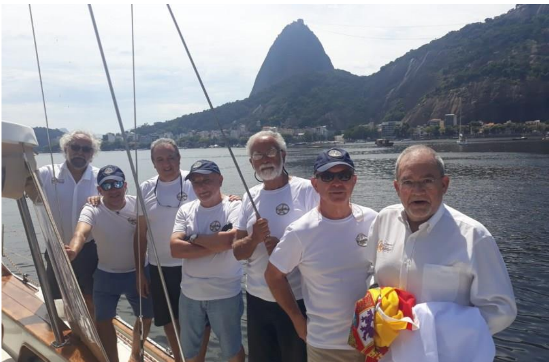
La tripulación del PROS en la etapa Río de Janeiro-Buenos Aires con el Pan de Azúcar al fondo

Colabore con nosotros. Si desea HACERSE SOCIO DE AGNYEE , puede informarse en: https://agnyee.org