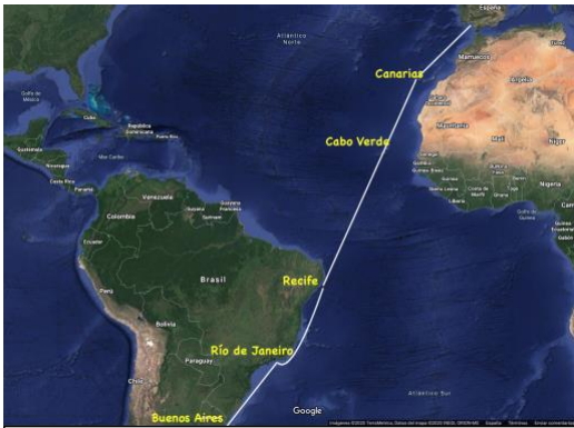
Travesía del Atlántico y derrota hasta Buenos Aires