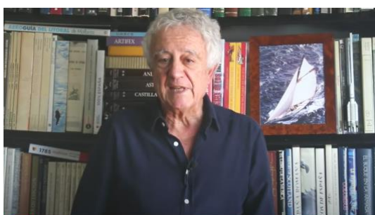
I Conferencia de AGNYEE “Tras la Estela de Elcano”