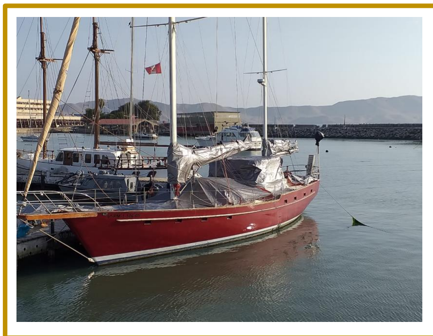
El velero PROS espera en Lima, adecuadamente “empaquetado”, la reanudación de la Expedición