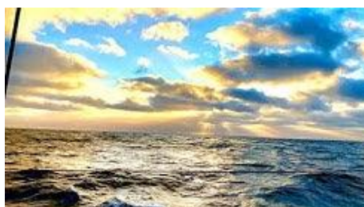
II Conferencia de AGNYEE “Tras la Estela de Elcano”