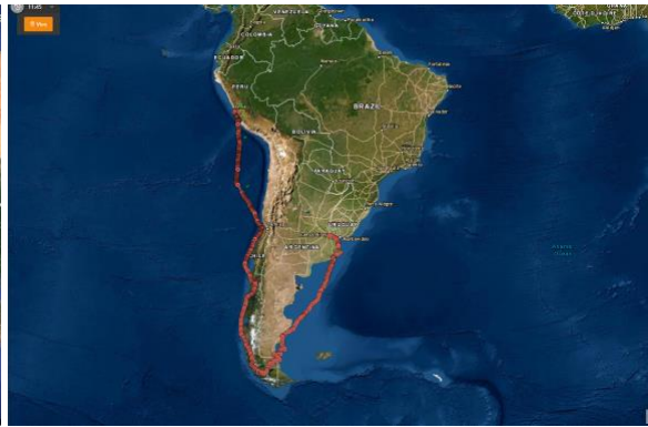
Desde Buenos Aires- Estrecho de Magallanes-Chile-Perú