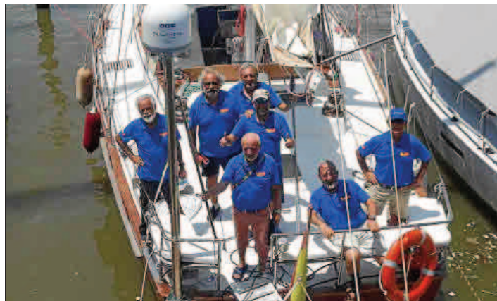
La tripulación, a su llegada a la capital argentina, a bordo del velero.