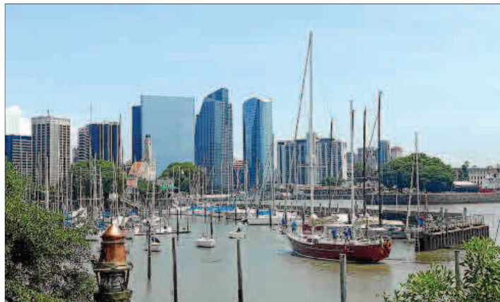
Panorámica del puerto, durante la llegada de la embarcación.

Este proyecto de la entidad sin ánimo de lucro Amigos de los Grandes Navegantes y Exploradores Españoles (Agynee), aprovecha la ocasión para recordar también la travesía de quienes fundaron la primera ciudad de Estados Unidos, San Agustín, muchos de ellos menorquines. Así, antes de regresar a España, volverán a cruzar el Atlántico para llegar a Florida. Pero eso ya será en septiembre de 2022, tras haber empezado el pasado agosto.