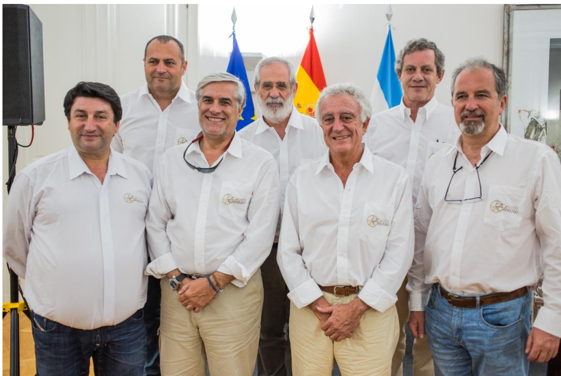
La tripulación del PROS (Etapa 4) posa en la Embajada española de Buenos Aires