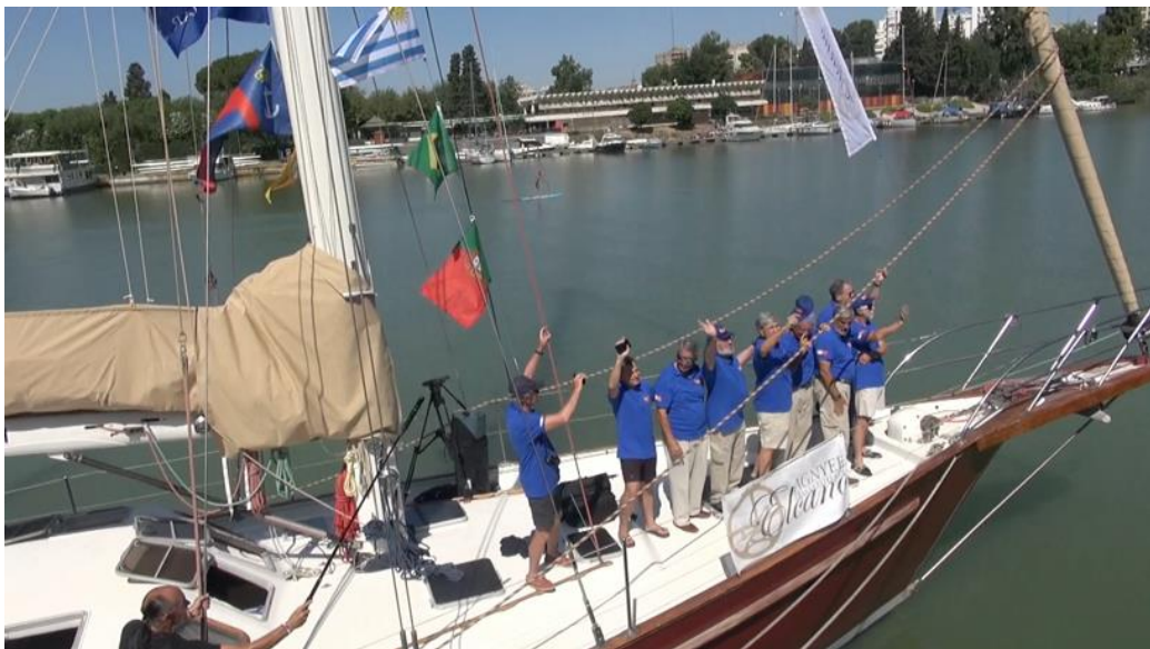
La tripulación del PROS a su salida de Sevilla el 10 de agosto