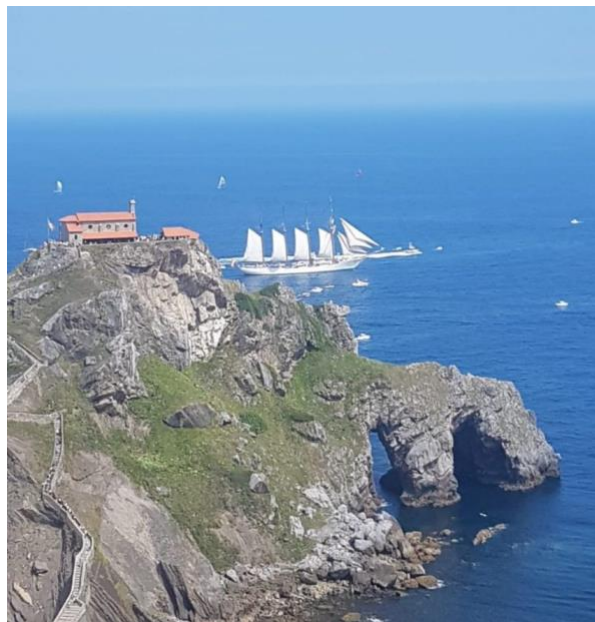
El J.S. Elcano a su paso por S. Juan de Gaztelugatxe