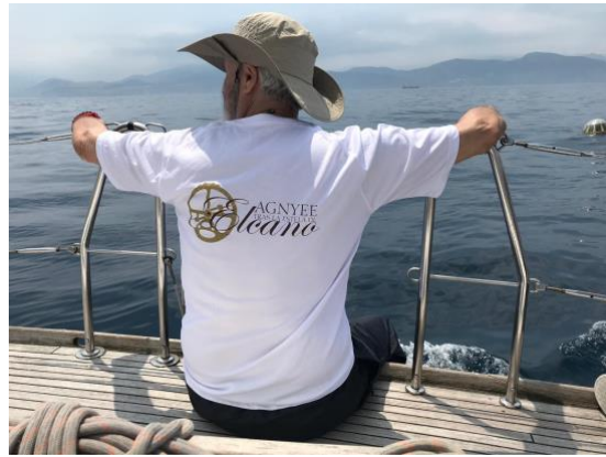
Soñando ya con la Vuelta al Mundo