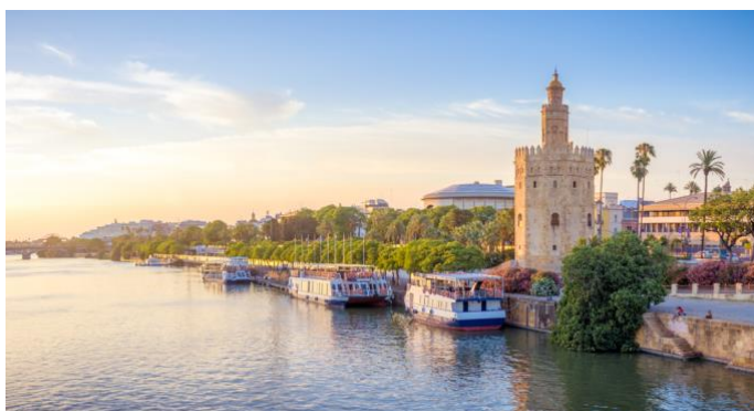
La Torre del Oro de Sevilla desde el río