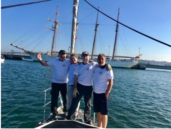
Con la camiseta de Agnyee ante el J.S. Elcano en Bilbao